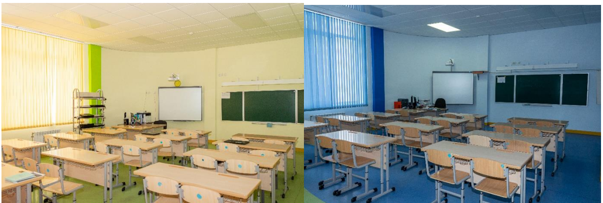
Рис. 13. Учебные кабинеты