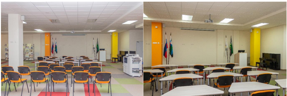
Рис. 14. Лекторий