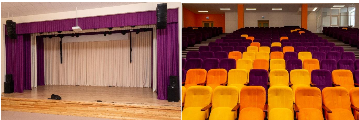
Рис. 2. Концертный зал