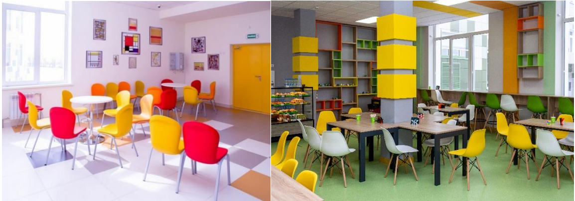
Рис. 12. Зона коворкинга