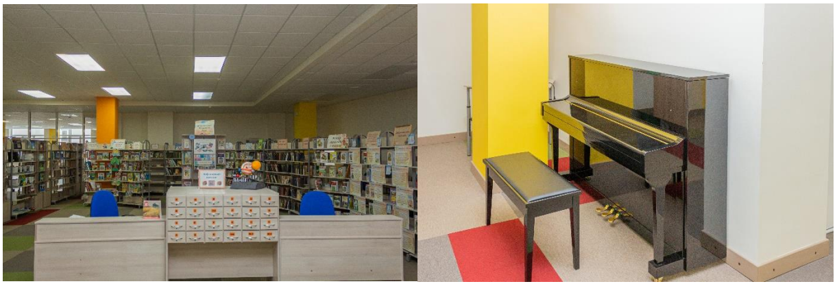
Рис. 3. Библиотека