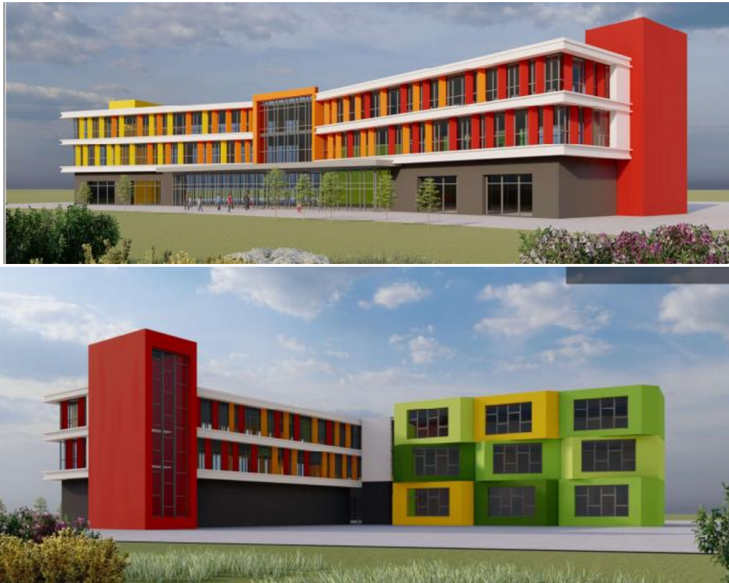
Рис. 1. Кампус для проживания с учебным корпусом