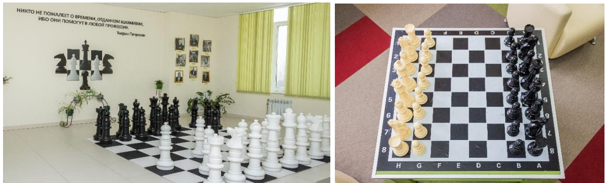
Рис. 16. Шахматная зона