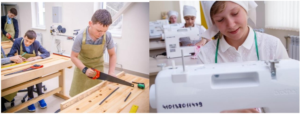
Рис. 11. Мастерские