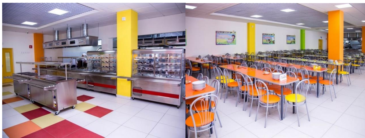
Рис. 8. Столовая