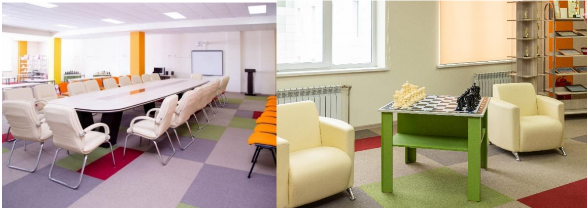
Рис. 4. Конференц зал