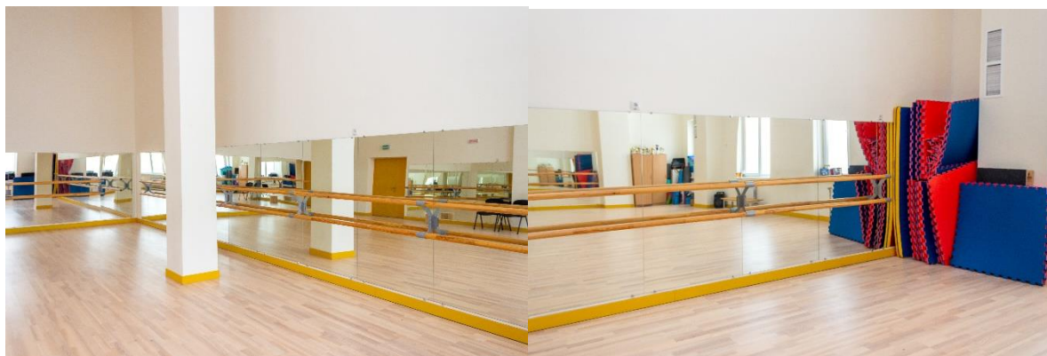
Рис. 7. Хореографический зал