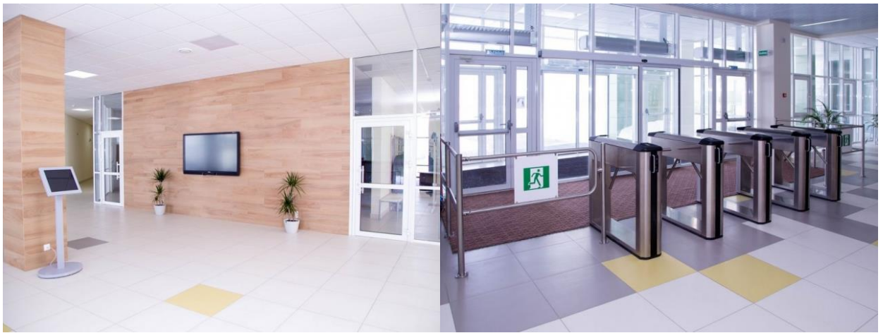
Рис. 15. Холл