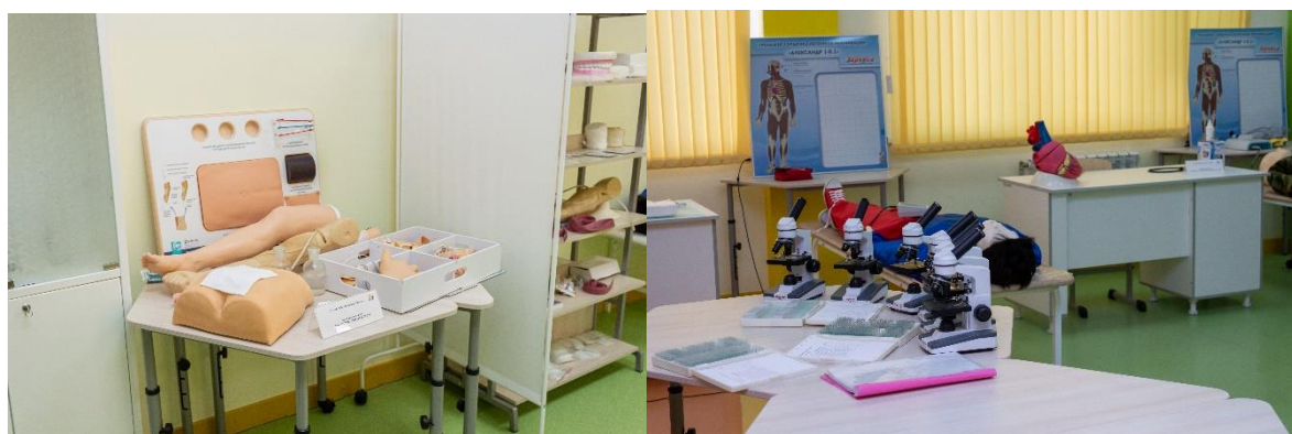
Рис. 9. Лаборатория медицины и фармации